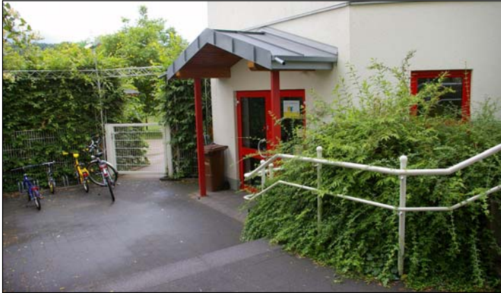
Hereinspaziert ...hier geht's in die Rappelkiste!