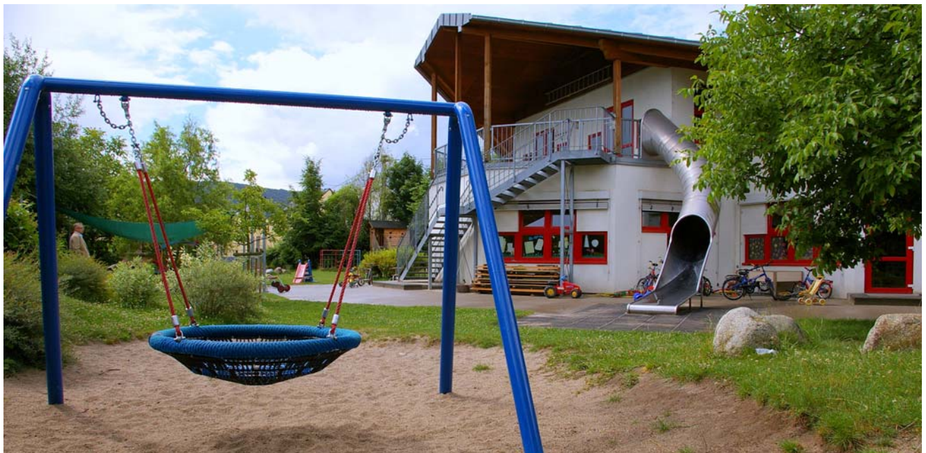
Die „Kehrseite“ der „Rappelkiste“: Ein attraktives Angebot an altersgerechten Spielgeräten inmitten von viel Natur lädt die Kinder zum Aufenthalt an der frischen Luft ein. Klar, dass die Röhrenrutsche für sie eine besondere Attraktion darstellt.

Der Förderverein unterstützt die Arbeit in der Kita mit Anschaffungen, die mit dem normalen Budget nicht zu finanzieren sind. Z.B. Anschaffung einer Nestschaukel 2007, einer Videokamera, einen zusätzlichen PC für die Kinder oder jährliche kleine Geschenke zu Nikolaus für alle Kinder. Elternausschuss- und Fördervereinmitglieder beteiligen sich auch an der Durchführung organisatorischer Dinge in der Kindertagesstätte. Z.B. Helfen Sie bei Festen mit bei der Vor- und Nachbereitung.