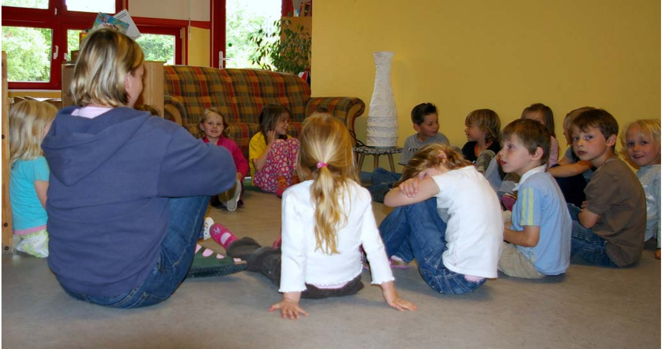
Im Sitzkreis wird ein neues gemeinsames Projekt besprochen

Materialien werden dem Projekt entsprechend frei gewählt, gestaltet und verändert. Die Kinder werden ganzheitlich angeregt und gefördert (Glossar).