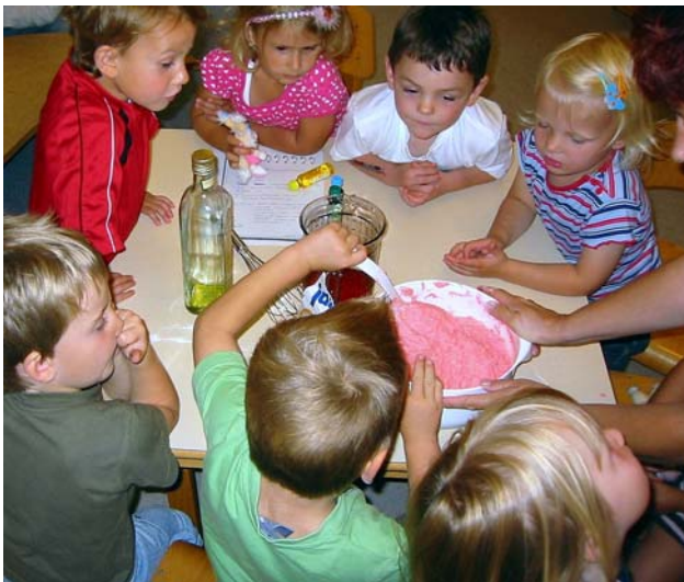
Wir stellen Knete selbst her