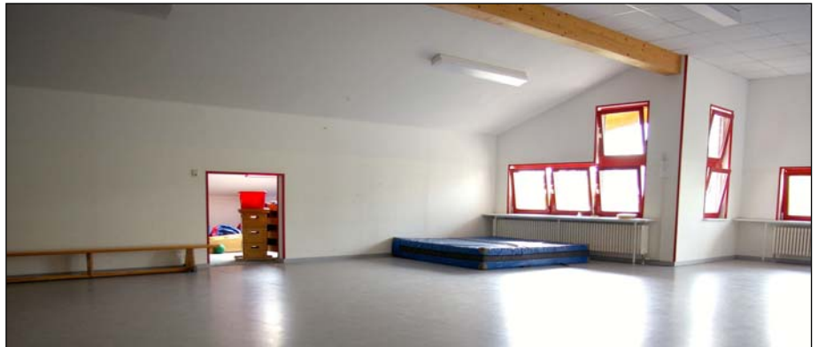
Viel Platz für Bewegung: der Mehrzweckraum / die Turnhalle

Kinder haben ein starkes Bewegungsbedürfnis. Deshalb legen wir Wert darauf, ihnen im gesamten Tagesablauf ausreichend Raum und Zeit zum Toben, Laufen usw. zu geben. In unserem Mehrzweckraum, dem Turnraum, dem Flur oder auf dem Außengelände finden die Kinder ausreichend Anreize für Bewegungsspiele aller Art. Bei den wöchentlichen Turnstunden wird