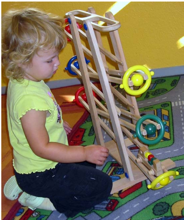
Tyra sammelt erste Erfahrungen mit der Schwerkraft

Mit einer guten und zeitintensiven Eingewöhnung legen wir -gemeinsam mit Ihnen- den Grundstein, dass sich Ihr Kind in seiner neuen Umgebung wohl fühlen kann. Von Kind zu Kind variiert die Dauer der Anwesenheit der vertrauten Person – sie kann bis zu 14 Tagen andauern!