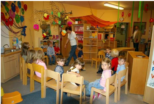
Ein neuer Sitzkreis: Gedankenaustausch nach Projektabschluss

im Verlauf eines Projektes können einzelne Angebote verschoben, verändert werden oder ausfallen. Es ist auch möglich, dass sich aus dem Ausgangsthema ein neues Thema ergibt. Es erfordert viel pädagogisches Geschick, das Interesse der Kinder zu bewahren und gleichzeitig den „roten Faden“ nicht aus den Augen zu verlieren.