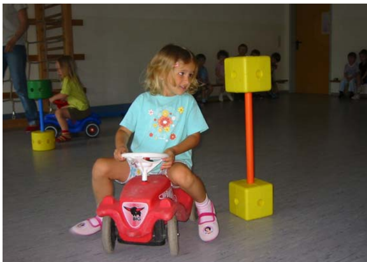
Geschicklichkeitsübungen und Wahrnehmungsspiele in der Turnstunde

Gegen Ende des Vormittags treffen sich alle Kinder in ihren Gruppen zu einem gemeinsamen Abschluss. Dieser kann in Form eines