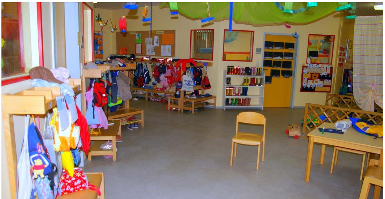
Garderobe, zentraler Treffpunkt, Spielplatz und noch viel mehr: der Flur des Hauses

Informationen zu den aktuellen Handlungszielen sind bei der Einrichtungsleitung zu erhalten.