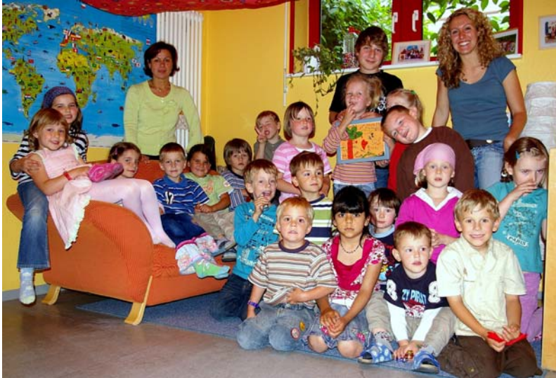
Fast wie in einer Großfamilie: Verabschiedung eines Praktikanten