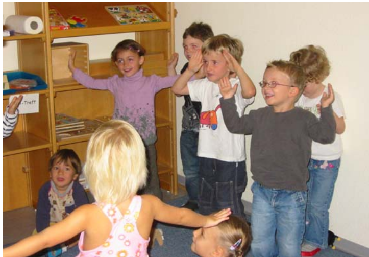
Viel Spaß bei Sing- und Bewegungsspielen