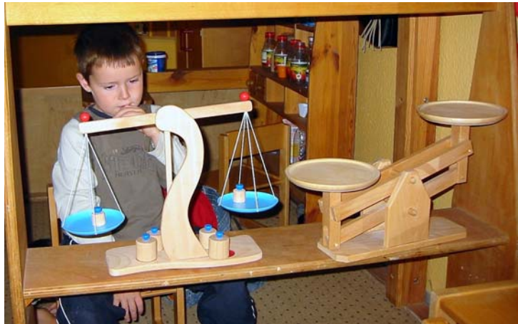
Wiegen und Messen im Kaufladen als spielerische Vorbereitung auf die Schule zur Förderung des mathematischen Verständnisses